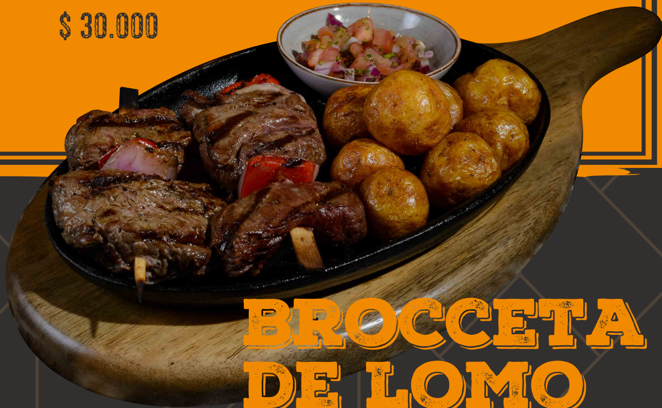
BROCCETA DE LOMO